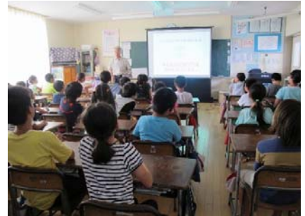
（行政相談出前教室）