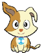
総務省行政相談センター

茨城県内には、「茨城行政監視行政相談センター」（総務省行政相談センター・きくみみ茨城）が設置されています。